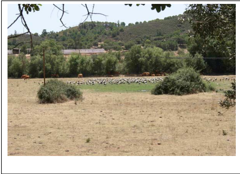
Weißstorchansammlung zwischen Silves und Portimao