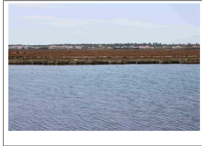
Lagune bei Castro Marim: Hier waren Löffler anzutreffen