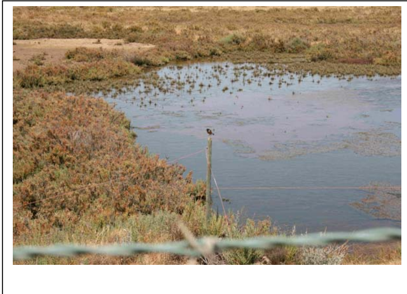
Schwarzkehlchen im Ria Alvor