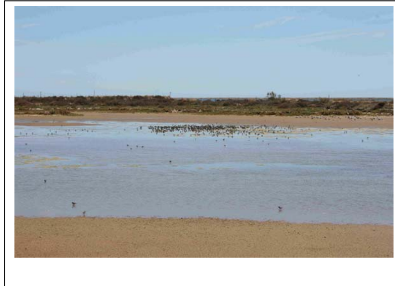
Alpenstrandläufer in einer Lagune von Quinta do Lago